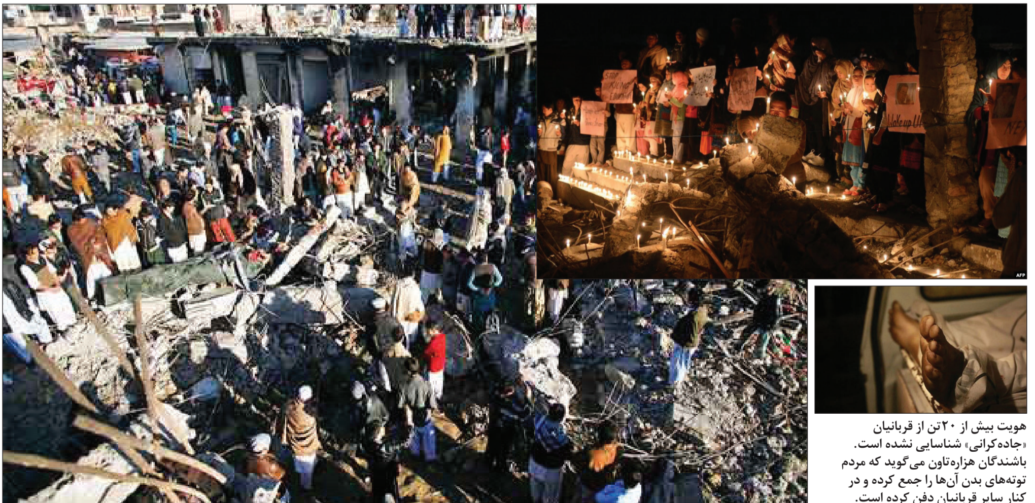
هویت بیش از ۲۰ تن از قربانیان «جاده کرانی» شناسایی نشده است. باشندگان هزاره تاون می گوید که مردم توتہ‌های بدن آن‌ها را جمع کرده و در کنار سایر قربانیان دفن کرده است.