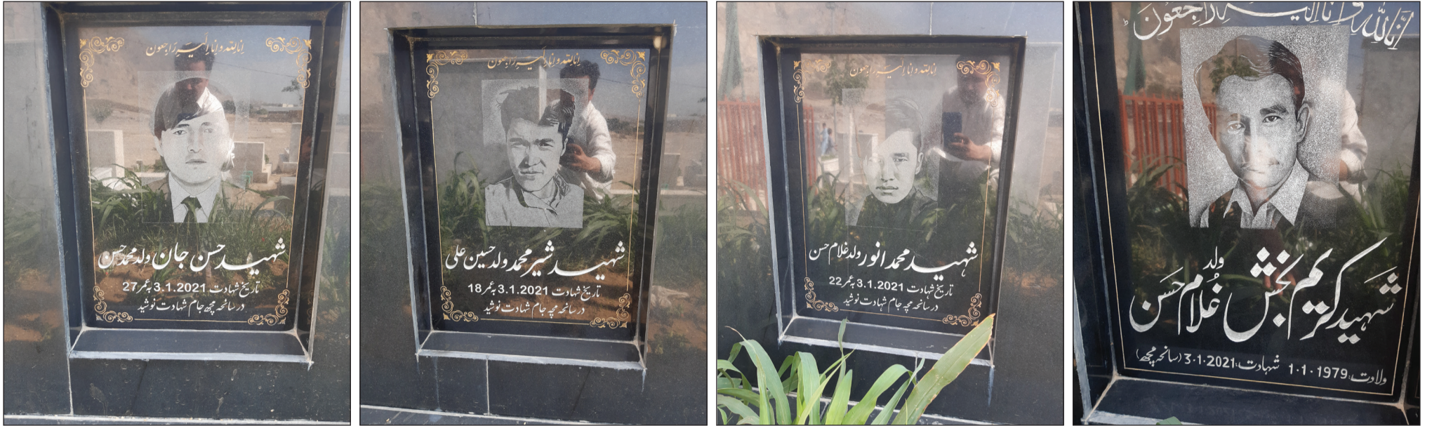
فہرست کشتارہای هدفمند و انفرادی ہزارہوں و شیعہوں بلوچستان پاکستان (۳)